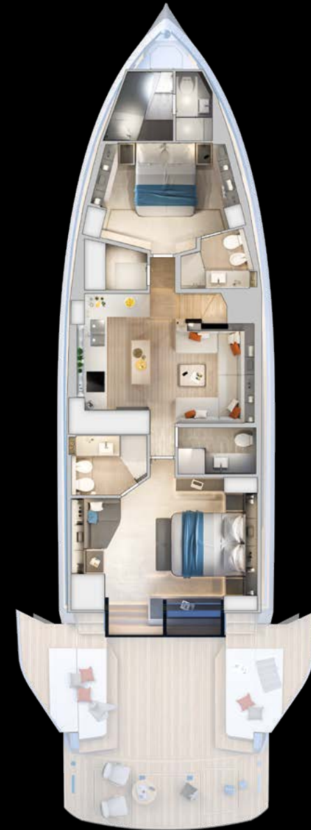
Lower deck Beach Version