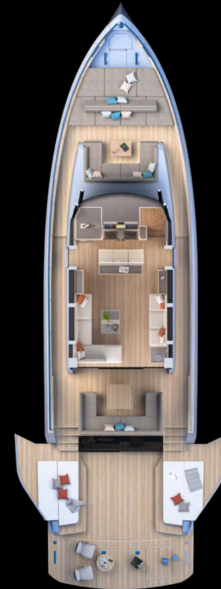
Main deck Beach Version