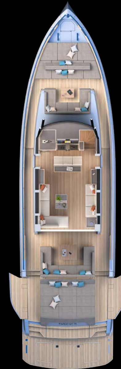
Main deck Tender Garage Version